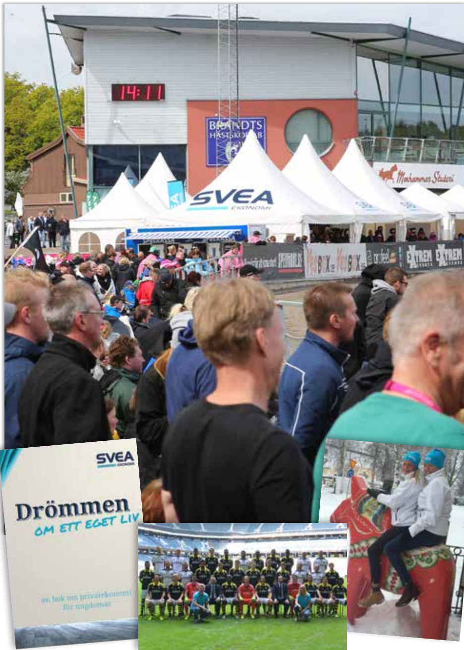
Exempel på sponsring och CSR-projekt: Huvudsponsor av Elitloppet och AIK Fotboll. Boken om privatekonomi för ungdomar, "Drömmen om ett eget liv". Utställare på Vasaloppsmässan i Mora under hela Vasaloppsveckan.