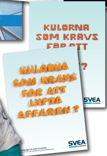
Diverse händelser efter bokslutsdagen: Reklamfilm Kulorna som krävs och Sponsring av vädret på TV4, Huvudsponsor Elitloppet 2015, Vasaloppsmässan i Mora.