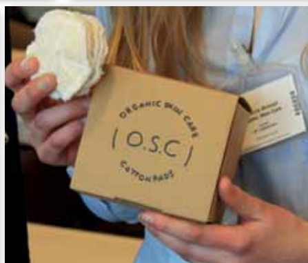
Händelser efter bokslutsdagen: Sponsring- och CSR-aktiviteter våren 2014 AIK Fotboll, Elitloppet 2014, Sollentuna FK, UF-Företaget Organic Skin Care.