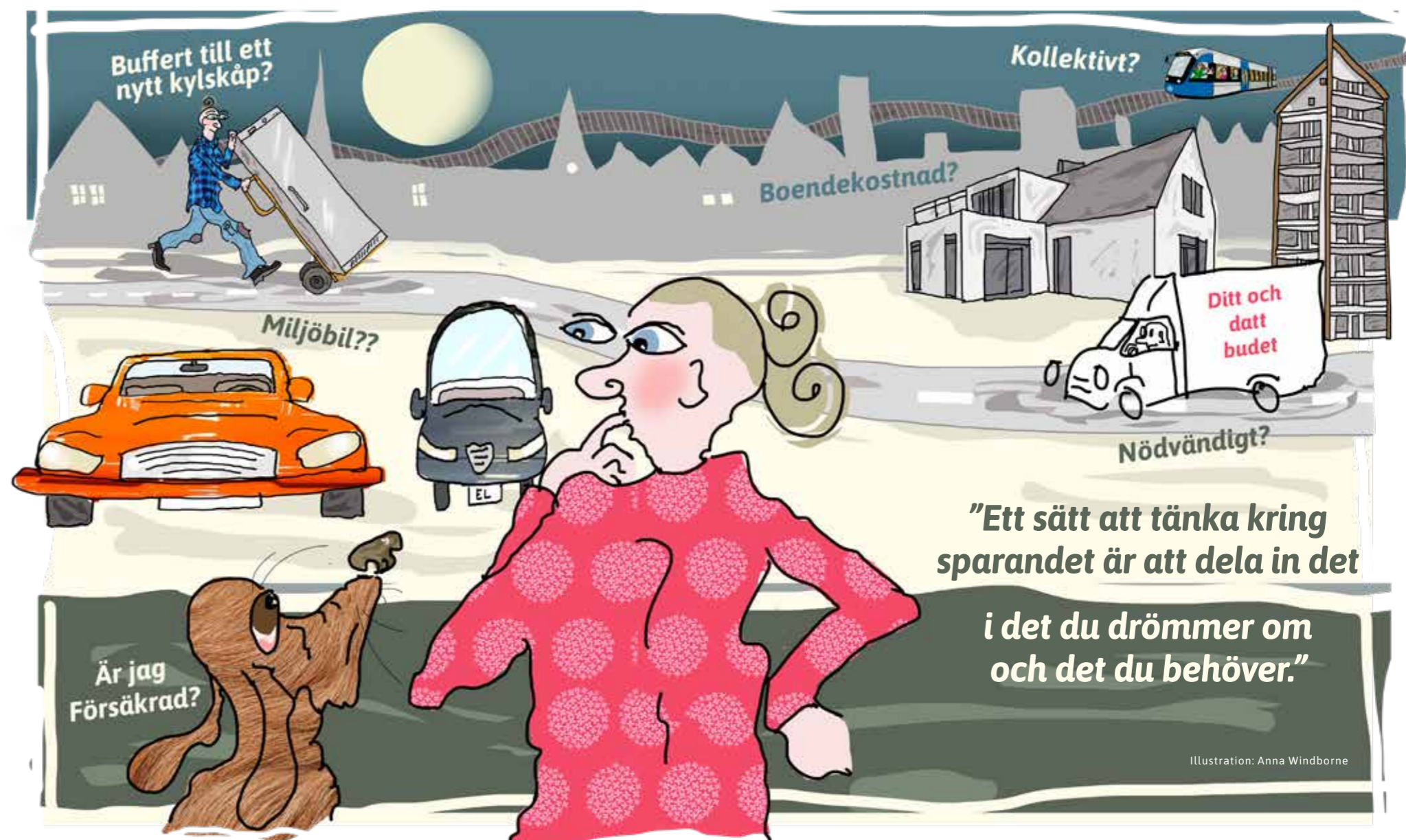
Illustration: Anna Windborne

– Tvärtom har flera banker nyligen sänkt sina borrhäntor. För dig som har