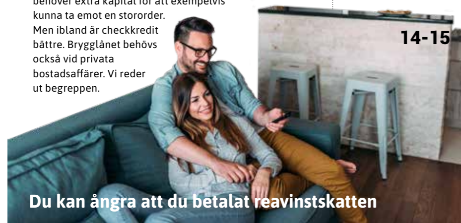
Du kan ångra att du betalat reavinstskatten

Bryggglån kan vara räddningen för ett företag som behöver extra kapital för att exempelvis kunna ta emot en stororder. Men ibland är checkkredit bättre. Bryggglånet behövs också vid privata bostadsaffärer. Vi reder ut begreppen.