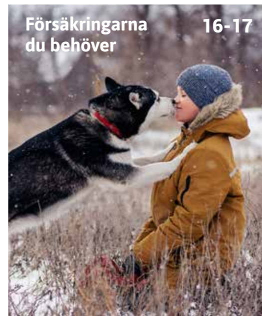
Försäkringarna du behöver