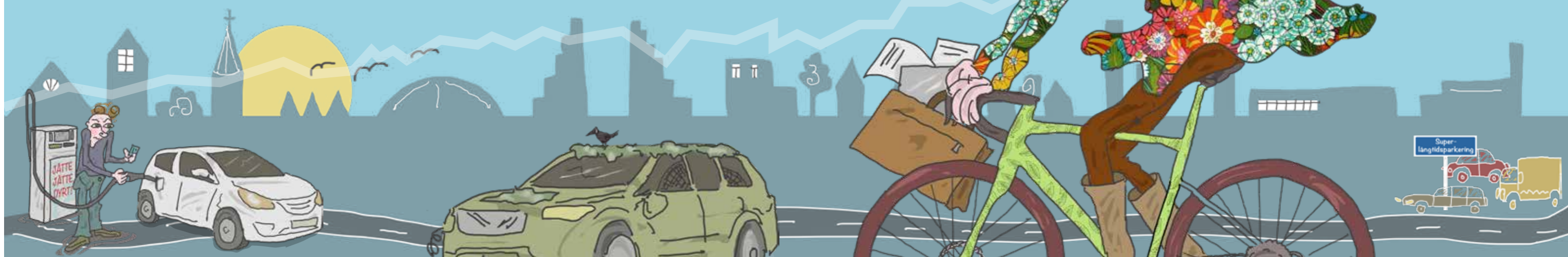
Illustration: Anna Windborne

Drivmedelspriserna har chockhöjts. Den billiga cykeln är åter räddningen för många. Sedan första januari i år kan du dessutom få en skattelättnad på förmånscykel av din arbetsgivare. Ett sätt att spara på dina egna utgifter och dessutom ett plus för både kropp och själ.